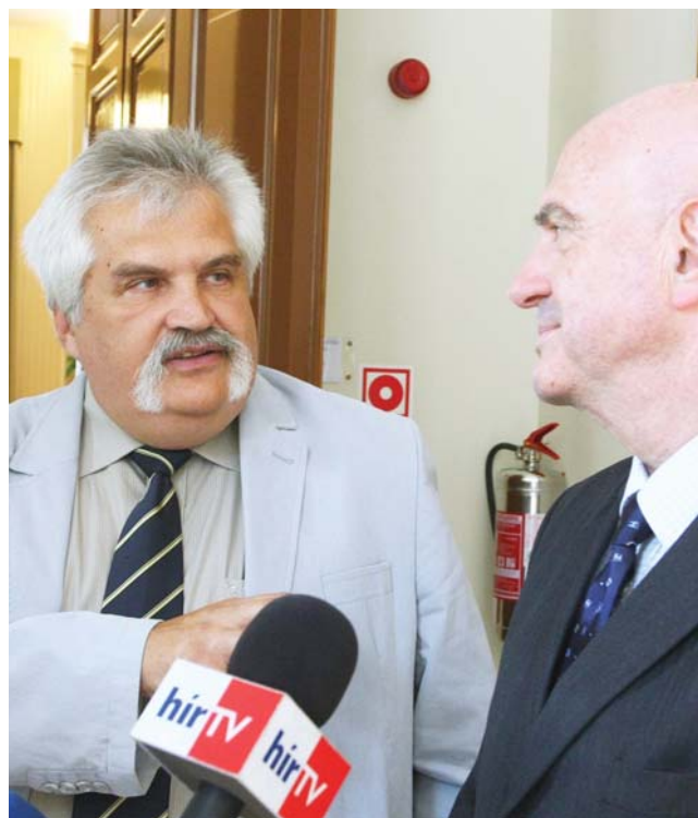
Egy-egy magas rangú diplomata látogatása a sajtó érdeklődését is vonzza.