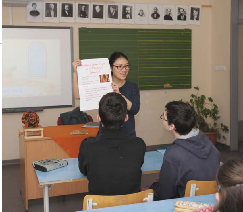
Az SZTE Konfuciusz Intézetben kínai oktatók segítségével sajátíthatjuk el a nyelvet.

Nagy Édától megtudtuk, egy alapfokú nyelvtanfolyam hat modulból áll, a Szegedi Tudományegyetem Konfuciusz Intézetében a legmagasabb szinten a negyedik modulnál tartanak a tanulók. A diákoknak