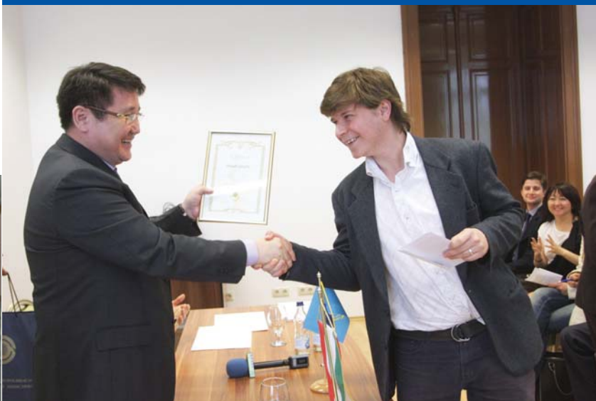
Nurbakh Rustemov, a Kazah Köztársaság nagykövete díjakat is átadott az SZTE hallgatóinak.

A diplomaták látogatásai során folytatott egyeztetések sokszor az egyetemi kereteken is jóval túlmutatnak. A kínai nagykövettel történt egyeztetések eredményeként például az ázsiai fél jelezte, a magyarországi befektetési területén kész újragondolni bizonyos hangsúlyokat, ezenkívül kinyilvánította érdeklődését a szegedi gyógyszerész- és egészségtudományi kutatások mellett az ilyen vonatkozású beruházások iránt is.