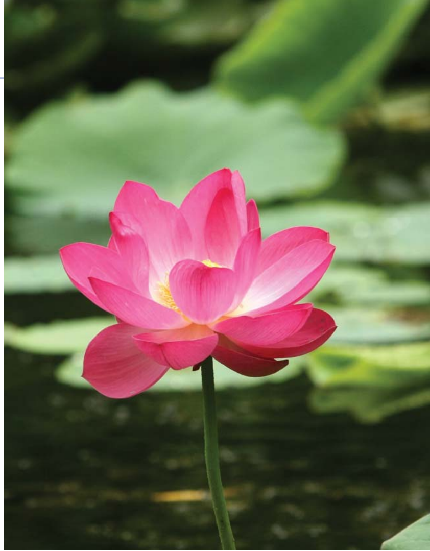
A kert egyik emblemikus faja az indiai lótusz, virágzásakor rendezik minden évben a Lótusz Napokat.

Az utóbbi években KEOP-pályázatok támogatásával megújult a növényszaporító ház, kitisztították a vizes élőhelyeket. A KEOP – 7.3.1.3/09-2010-0027 pályázat révén az eddig csupán fóliával fedett növénygyűjtemény került valódi üvegházba. Ez a munka 2012 szeptemberének végén fejeződött be, a hivatalos átadóra novem-