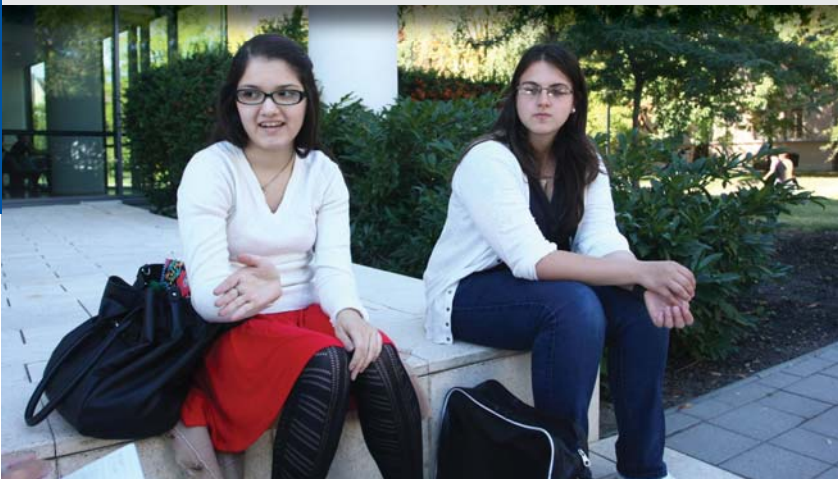
A diák-tanár arány is kiemelkedően jó Szegeden.

Számos nemzetközi és hazai felmérés rangsorolja a legkülönbözőbb szempontok szerint a felsőoktatási intézményeket, ám egy közös van bennük: a fővárosi egyetemek mellett – egyetlen vidéki universitasként – a Szegedi Tudományegyetem mindegyiken ott van a legjobbak között!