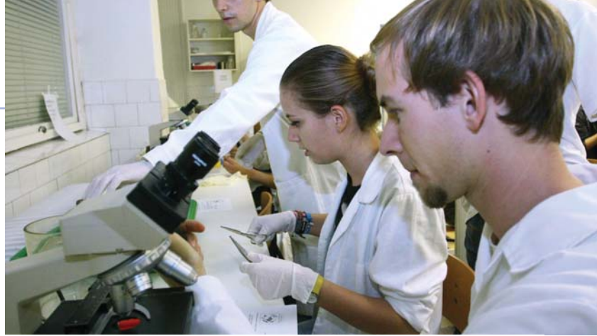
Az SZTE KKK kutatásaiban számos fiatal, hallgató és doktorandusz is részt vett.

Az információs társadalom alprogram mintegy 300 különböző kutatási témát fogott össze a gazdaság, a jog, az informatika, a matematika, a társadalom- és bölcsészettudomány, valamint a digitalizá-