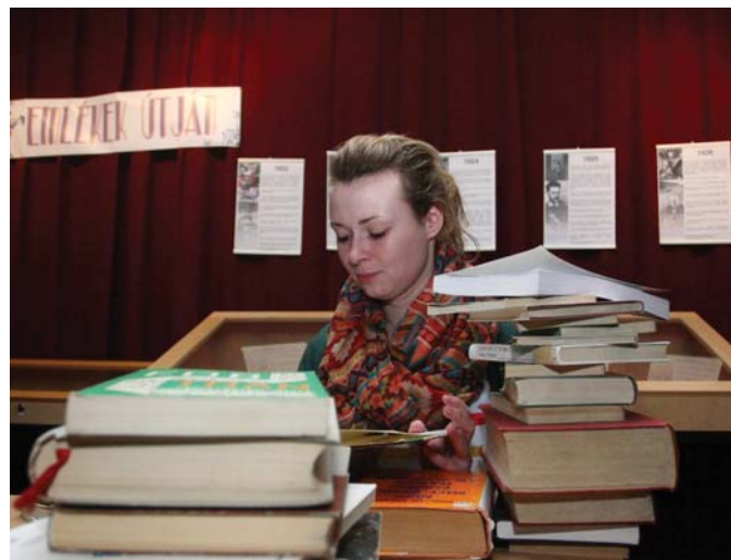
A hallgatók döntő többsége színvonalasnak tartja az SZTE-n folyó oktatást.

Az ősszel nyilvánosságra hozott, immár hagyományosnak számító hazai felmérések mindegyikében remekül szerepelt az SZTE, mely tartja helyét a közvetlen élmezőnyben. A Heti Válasz hetilap és a CEMI (Central European Management Intelligence) összeállítása különböző, az oktatás színvonalát, valamint a diákok preferenciáit tükröző, nyilvánosan elér-