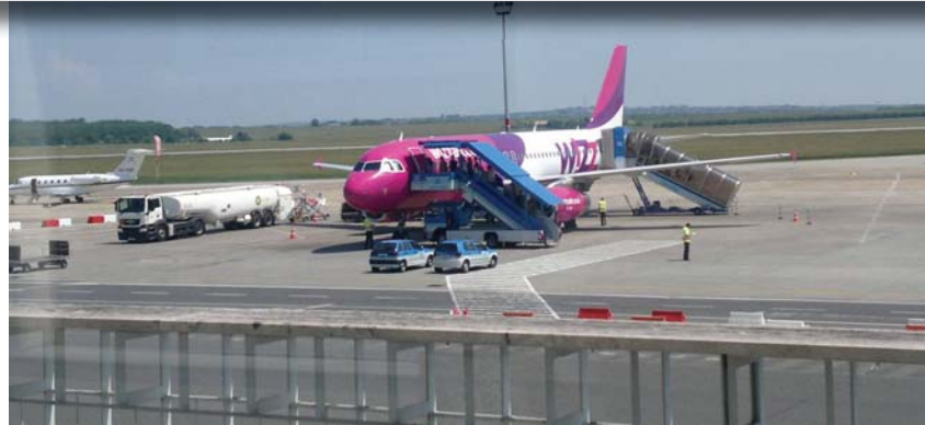
Vigyázz, kész, AIESEC: több mint százöt országban működik a nemzetközi szervezet.

A szervezet számos programot gondoz, mint például a The Experience önkéntes program, melynek segítségével a középiskolás vagy egyetemista „kiküldöttek” ta-