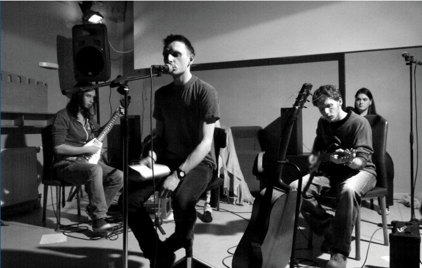
A Szegedi Egyetemi Színház is szívesen merít József Attila munkásságából.