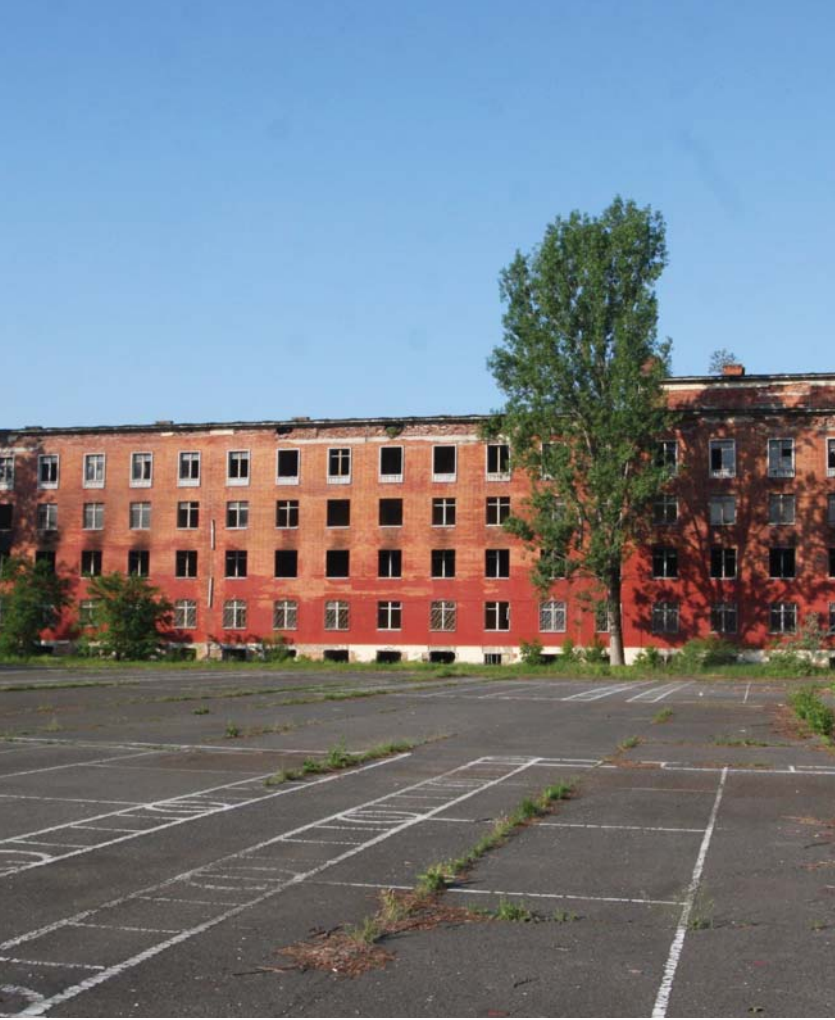
Az SZTE öthalmi területén alakítják ki a lézerközpontot.