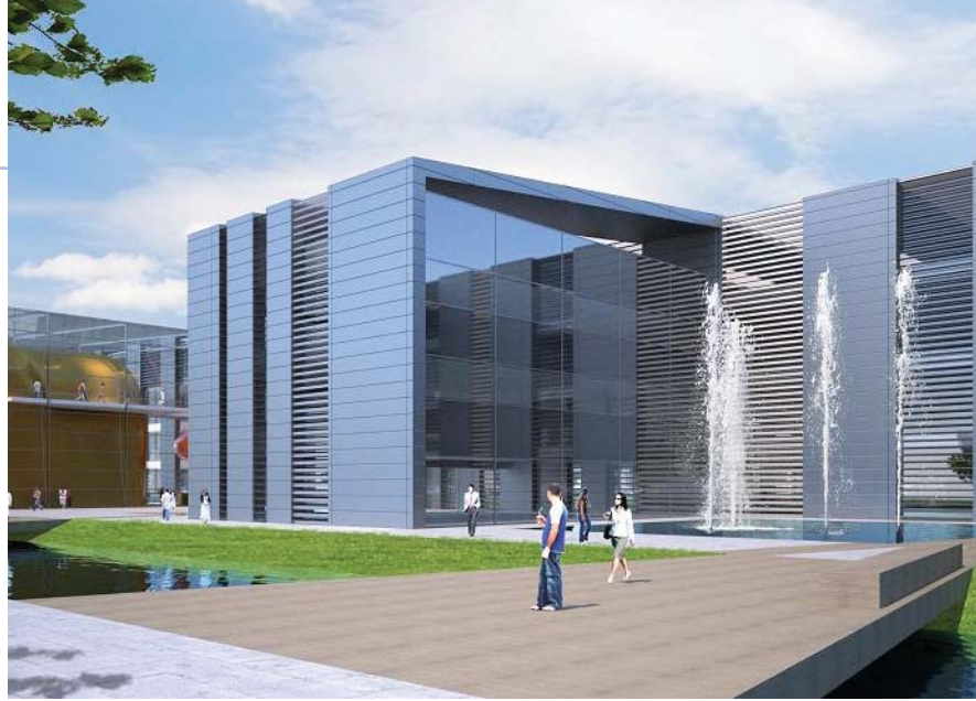
A szegei lézerközpont látványterve.

A csúszások miatt a Nemzeti Fejlesztési Kormánybizottság vizsgálatot is indított nyár végén, majd októberben a Nemzeti Fejlesztési Minisztérium (NFM) azt hangsúlyozta, kiemelt figyelemmel kíséri az ELI-t. A projekt gyorsítását szolgálja, hogy a hatósági szinteket és feladatokat előre kijelölték egy kormányrendeletben.