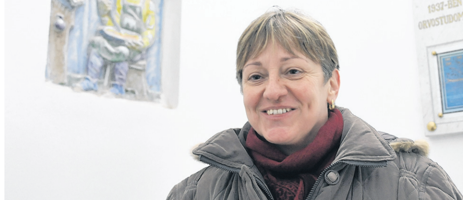
Hernádi Klára kedvence a dörzsmozsaras alkimistafigura.