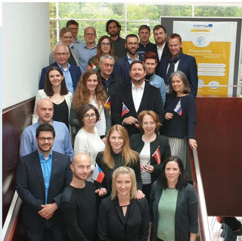
A partnerség csoportfotója a ProsperAMnet projektindító találkozáján, 2019 május 6-7.