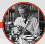
Szent-Györgyi TUDOMÁNYOS MŰHELY

A laborlátogatások 12 különböző csoportban történnek. Csoportonként két laboratórium kerül bemutatásra.