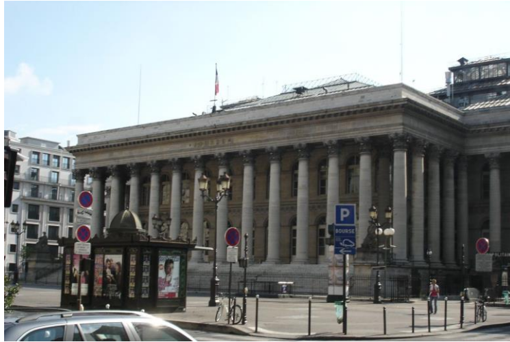
(le bâtiment de la Bourse à Paris)

Observez les deux photos. Saisissez leur sujet commun, développez-le, puis exprimez votre point de vue sur cette question.