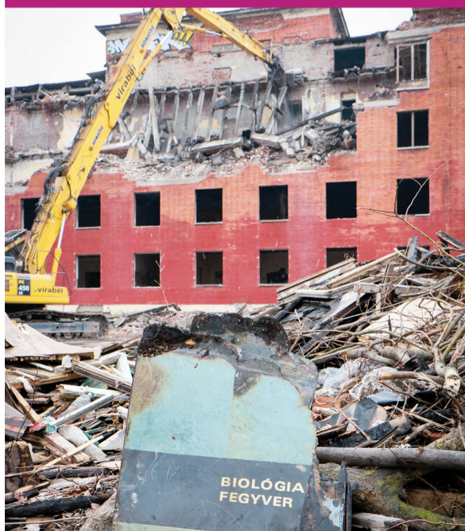
Befejeződött a régi épületek bontása az ELI lézeres kutatóközpont körül, a szegedi egyetemhez kötődő Science Park területén. A kormány támogatásával hamarosan megkezdődik a teljes körű, a befektetők igényeit maximálisan kiszolgáló közmuvelőpítés, valamint a belső úthálózat fejlesztése.