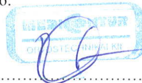
Medicontur Orvostechnikai Kft.