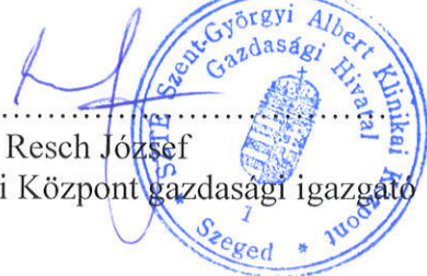
Resch József Klinikai Központ gazdasági igazgató