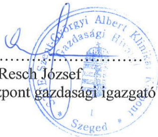
Resch József Klinikai Központ gazdasági igazgató